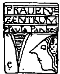
Frauenzentrum Paula Panke e.V.